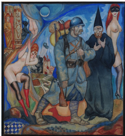
« Phantasmes » d'Alexandre Zinoviev

L'entrée en guerre des américains , Conférence p.15