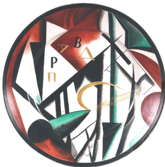
Assiette révolutionnaire russe, coll. Historial de la Grande Guerre

La révolte est un thème presque invisible en Grande Guerre. En 1917, le public ne voit rien des grèves qui agitent la société française à l'arrière ni des mutineries sur le front. La presse française n'hésite pas à se rendre à l'étranger pour contourner les interdits et l'on peut se demander si l'information sur la violence de la révolte russe et même les refus de combat ne disent pas en filigrane les événements.