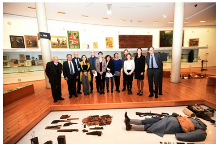
Remise de bourses 2016

Avec le soutien du Conseil départemental de la Somme et de la Fondation Gerda Henkel, le Centre international de recherche de l'Historial de la Grande Guerre remettra des bourses de recherche à des étudiants travaillant sur la thématique de la Grande Guerre. Chaque étudiant présentera son sujet de thèse en cinq minutes. Cette cérémonie sera conclue par un verre de l'amitié à 18h.