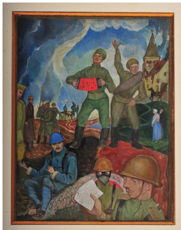
« Le joueur d'accordéon, 1916 » d'Alexandre Zinoviev collection Historial de la Grande Guerre - photo Y. Medmoun

Durant tout le conflit, il réalise des dessins aquarellés exprimant non seulement les conditions de vie des soldats, russes et français, mais aussi l'emprise du danger et de la souffrance exprimées de façon originale par leurs regards et leurs gestes. Ces représentations de grande intensité traduisent l'incompréhension face à l'absurdité de la guerre. L'œuvre de cet artiste combattant, complétée par ses photographies, est présentée en un parcours chronologique et thématique, et fait l'objet à cette occasion d'une publication chez Gallimard.