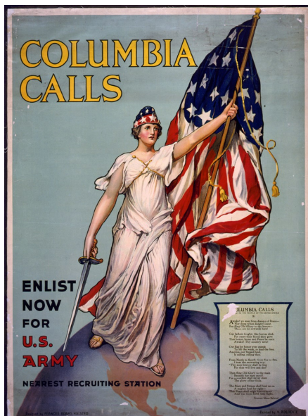
Columbia Calls

L'entrée en guerre des Etats-Unis en 1917 est un des événements les plus importants du 20 ème siècle. Néanmoins, les historiens n'ont pas étudié cette intervention au même niveau académique que d'autres événements fondamentaux de la Grande Guerre. Dans sa présentation, Michaël NEIBERG expliquera le chemin suivi par les américains et les liens entre les Etats-Unis et la France avant 1917. Il présentera une nouvelle manière de comprendre comment les Etats-Unis sont entrés dans la guerre.