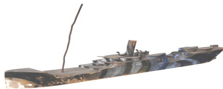
Maquette de navire camouflé

Maquette de navire camouflé